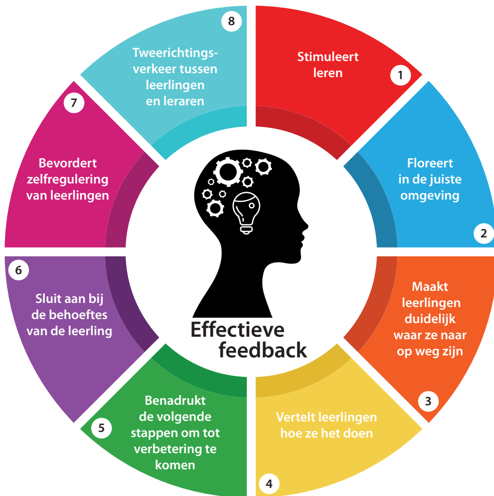
Figuur 1.1 Effectieve feedback om het leren te bevorderen