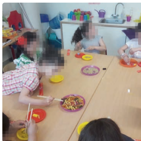
Materiaal om met stokjes te pakken bij de Uitdagingsbergen.